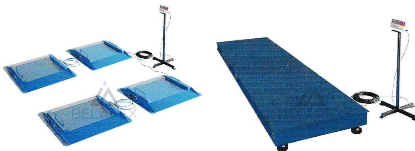
Рисунок 1 - Фотографии весов

Фотографии весов представлены на рисунке 1.